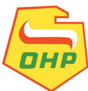
Centrum Edukacji i Pracy Młodzieży OHP w Pile